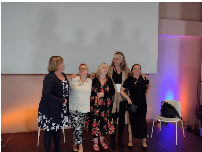
Założycielki La Strady na spotkaniu w Amsterdamie