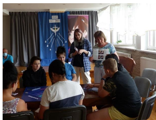
Zajęcia w MOW nr 2 w Warszawie i w domu poprawczym w Mrozach

Drugi projekt było to uaktualnienie przygotowanej w latach 2016/2017 aplikacji SAFE, przeznaczonej dla młodych osób planujących emigrację zarobkową. Zaktualizowano informacje dot. podejmowania pracy za granicą uwzględniając Brexit a także zwrócono uwagę na kwestie dotyczące uczciwości w łańcuchach dostaw. Do aplikacji przygotowano także manual (przewodnik), który również został uaktualniony i wysłany do kilkuset instytucji w tym: