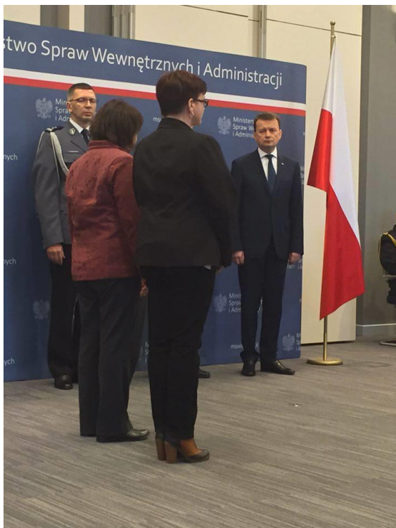
Czekając na odznaczenie...