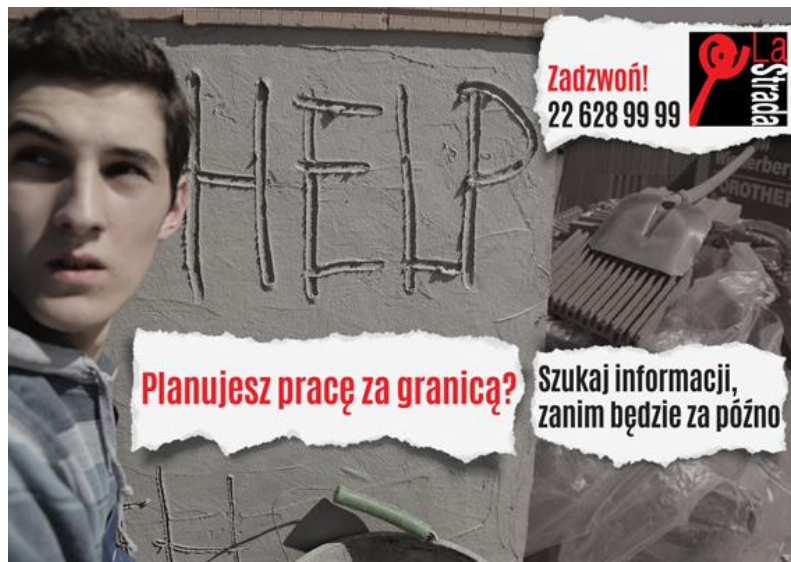
Pocztówka wydana w ramach projektu: „Promocja telefonu zaufania”

Od 1 września wspólnie z partnerami z La Strady Republika Czeska i IOM Słowacja realizowany był kilkumiesięczny projekt „ Promocja telefonu zaufania przeciwko handlowi ludźmi w szczególnie narażonych regionach Czech, Słowacji i Polski ”.