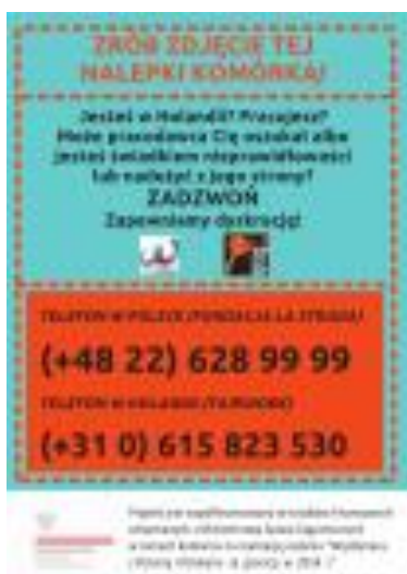
Nalepka z projektu „Np. Holandia”

i Niemiec. Ulotki do 612 powiatowych urzędów pracy. Raport z badań dostępny na: http://www.strada.org.pl/index.php/pl/wiedziec-wiecej/badania-naukowe